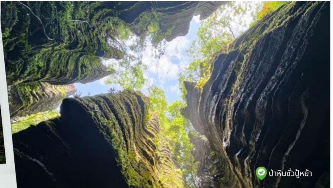
ป่าหินชั่วปู่หย่า