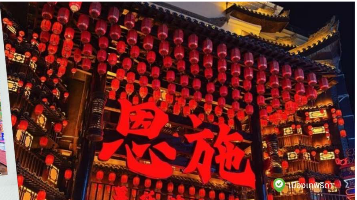
เมืองเอนซือ

เหมียว พื้นที่แห่งนี้เป็นถิ่นฐานของชาวฉู่เจียมาตั้งแต่สมัยโบราณ เมืองธิดาเอนซือฉู่เจีย ไม่เพียงแต่เป็นสถานที่สำคัญทาง ภูมิศาสตร์เท่านั้น แต่ยังเป็นซากดึกดำบรรพ์ที่มีชีวิตของวัฒนธรรมฉู่เจียอีกด้วย ดุจดั่งมารดาผู้เปี่ยมด้วยเมตตา คอยปกป้อง ประเพณีพื้นบ้านที่สืบทอดกันมารุ่นสู่รุ่นบนผืนแผ่นดินแห่งนี้สืบทอดมรดกอันยาวนานนับพันปีของชาติ ที่นี้รูปแบบ สถาปัตยกรรมโดดเด่น เมื่อก้าวเข้าสู่พื้นที่อันงดงาม สิ่งแรกที่สะดุดตาคือบ้านยกพื้นสูงที่จัดวางอย่างเป็นระเบียบ โครงสร้าง ไม้เหล่านี้ ซ่อนตัวอยู่ท่ามกลางเนินเขา ราวกับกลุ่มวิญญูณที่มีชีวิตชีวกำลังเต้นรำอยู่ท่ามกลางขุนเขาและผืนน้ำ