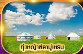
ทุ่งหญ้าชีลามูห์เริน