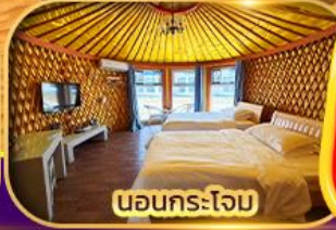
นอนกระโจม