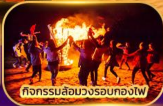
กิจกรรมล้อมวงรอบกองไฟ