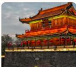
เมืองโบราณจิงโจว