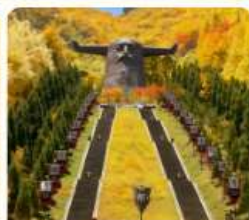
อุทยานเสินหลงเจีย