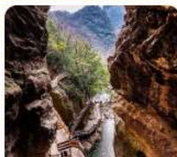
สะพานเทียนเซิง