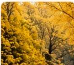
หุบเขาแปะก๊วย