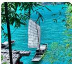
หมู่บ้านซานเซี่ย