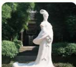
บ้านเกิดนางจ้าวจวิน

** รายการทัวร์อาจมีการเปลี่ยนแปลงตามความเหมาะสม โดยไม่ต้องแจ้งให้ทราบล่วงหน้า **