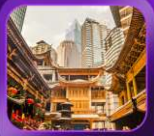
"วัดหลิวฮั่น"