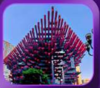
"อาคารตะเกียบ"

บินตรงจงชิง • อุ่หลง • ระเบิดงิ้ว • อุทยานแห่งชาติหลุมฟ้า • ลิฟต์แก้ว อุทยานเขานางฟ้า • ไค่วิ่งโหลซัน 1 กลายเป็นชั้นที่ 22 • อาคารตะเกียบ ถนนคนเดินเจียฟางเป่ย์ • หงหยาดัง • นั่งรถไฟกะลูดิก • วัดหลิวฮั่น