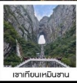
เขากิยเนหมินชาน

จางเจียเจีย • เขาวงตาร • ฟังหวง • ฟุหรงเจิน • ฉางซา