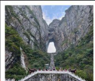
เขากิ๋นหมินซาน