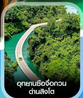
อุทยานซีจื่อกวน ด่านสิงโต