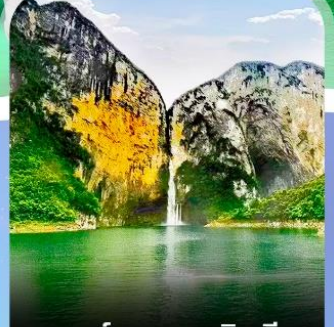
แกรนด์แคนยอนซิงเจียง