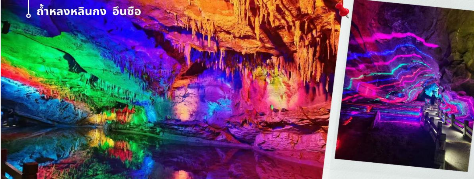
ถ้ำหลงหลินกง เอนซือ

จากนั้นนำทุกท่านเดินทางสู่ ถ้ำหลงหลินกงเอนซือ หรือที่รู้จักกันทั่วไปในชื่อ "ถ้ำน้ำ" ตั้งอยู่ทางตะวันตกของเมืองเอนซือ มณฑลหูเป่ย์ ห่างจากใจกลางเมือง 8 กิโลเมตร เป็นถ้ำที่มีภูมิประเทศทางภูมิศาสตร์ ประกอบด้วยถ้ำน้ำ ถ้ำเขาวงกต และถ้ำแห้ง มีความยาวรวม 2,300 เมตร ภายในถ้ำมีจุดชมวิวมากกว่า 200 จุด ได้แก่ แท่นบูชาหนึ่งแท่น สองพระราชวัง สามผาเก้ามังกร สิบสามวิหาร และสมบัติสี่สิบแปดชิ้น ถ้ำแห่งนี้ยังคงรักษาความมหัศจรรย์ทางธรณีวิทยาเมื่อ 500 ล้านปีก่อนไว้ อากาศอบอุ่นในฤดูหนาวและเย็นสบายในฤดูร้อน อุณหภูมิเฉลี่ยต่อปีอยู่ที่ 20 องศาเซลเซียส ปัจจุบันเป็นแหล่งท่องเที่ยว