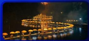
ล่องแพมิ่งทง

สัมผัสสายน้ำใสท่ามกลางธรรมชาติสองฝั่งทาง