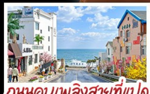
ถนนคอปเปลิ่งสายที่แปด