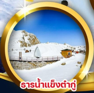
ธารน้ำแข็งต่ากู่