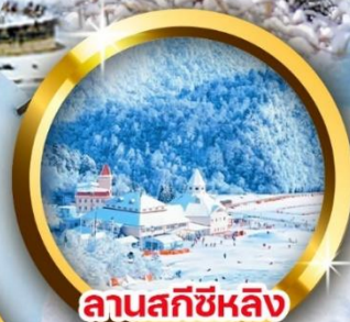
ลานสกีซีหลิง