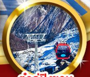
ต้ากู่ปิงชวณ

“เยือน 3 อุทยานระดับโลก” พินฮิมะต้ากู่ สี่ดรุณี ปี้เฉิงโกว ต้ากู่กลาเซียร์ (รวมรถอุทยาน+กระเช้าขึ้น-ลง) แชะภาพแฟนต้าเซลฟี ตะลุยซุนซีลู่