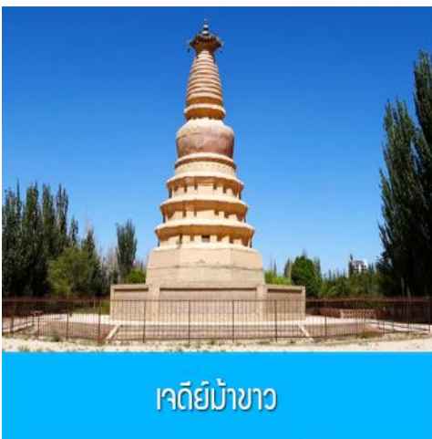
เจดีย์ม้าขาว

เที่ยง รับประทานอาหารกลางวัน ณ ภัตตาคาร (14)