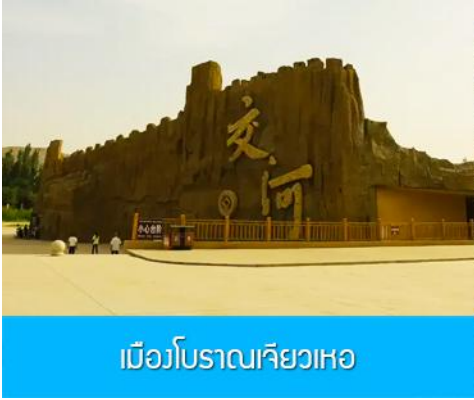
เมืองโบราณเจียวเหอ