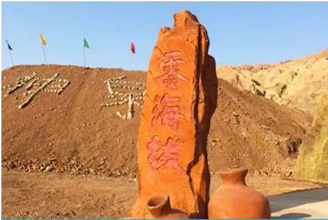
ภูเขาเปลวเพลิง