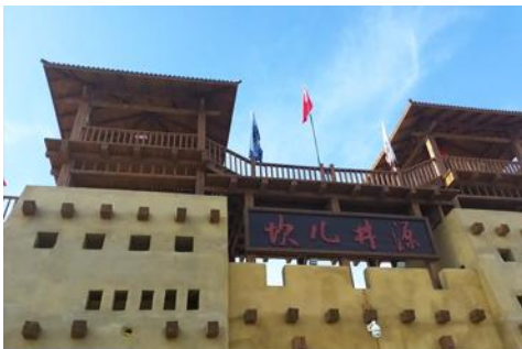
ระบบชลประทาน