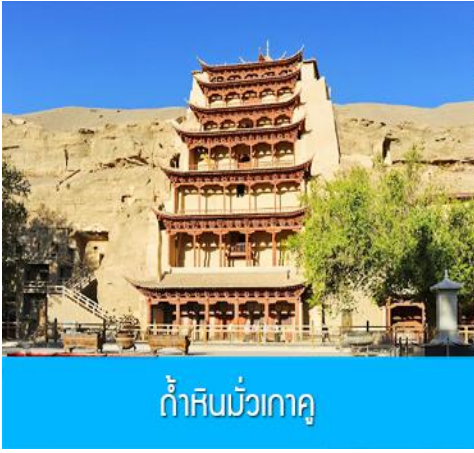
ถ้ำหินมั่วเกาถู

เช้า รับประทานอาหารเช้า ณ ห้องอาหารของโรงแรม (13)