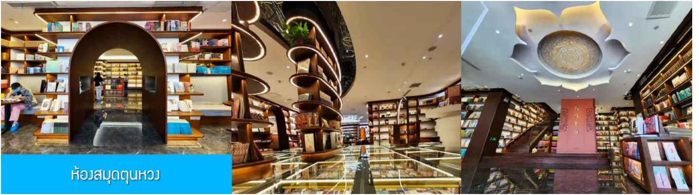
ห้องสมุด둔หว