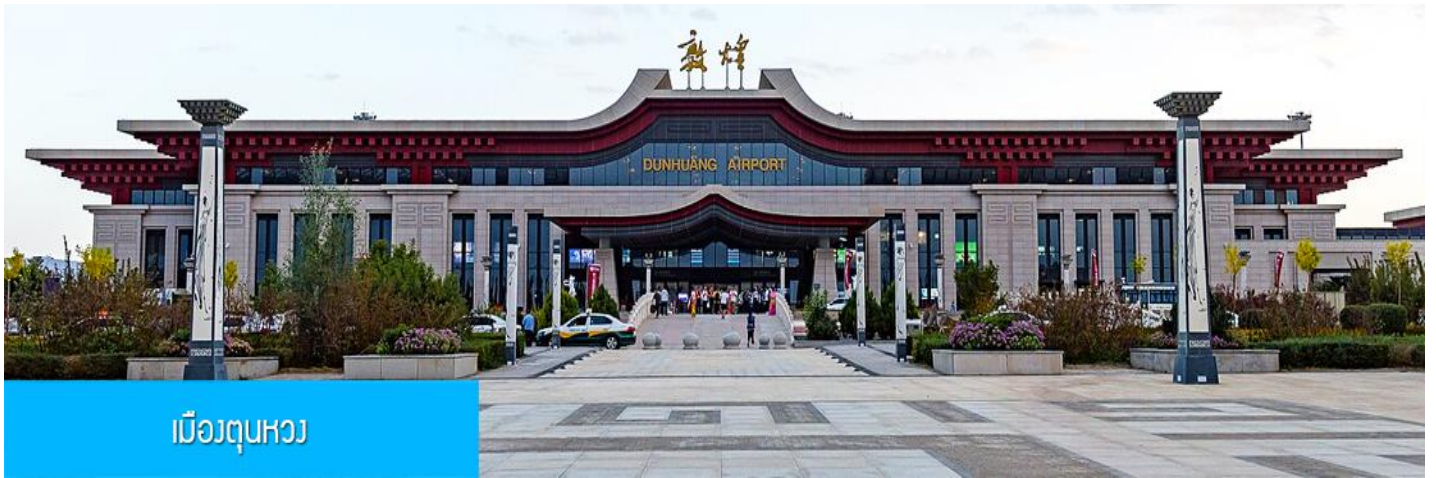
เมืองตุนหวง