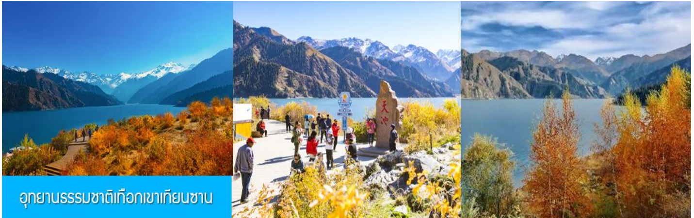
อุทยานธรรมชาติเทือกเขาเทียนชาน

รับประทานอาหารเช้า ณ ห้องอาหารของโรงแรม (7)