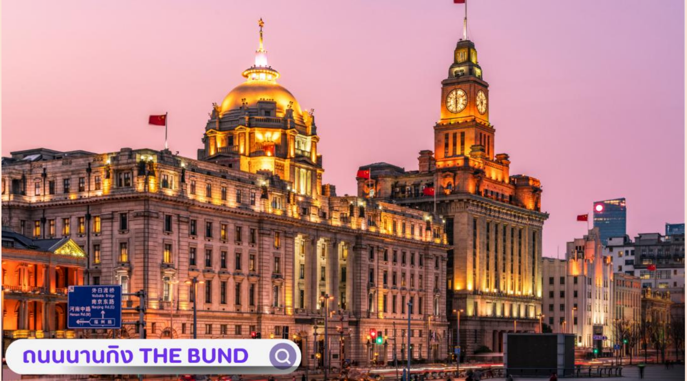
ถนนนานกิง THE BUND

จากนั้นอิสระท่านเฟลิดเฟลินที่ ถนนนานจิง(NANJING ROAD) เป็นย่านช้อปปิ้งเก่าแก่ที่สุดของเซี่ยงไฮ้ เป็นตลาดซื้อขายของกันคึกคักตั้งแต่ทศวรรษ 1920 ตั้งอยู่ฝั่งผู้ซีกินพื้นที่ยาวตั้งแต่ฝั่งตะวันตกของ “เดอะ บันด์” ถึง “พีเพิลส์ สแควร์” เป็นแหล่งช้อปปิ้งสินค้าแบรนด์เนมจากทั่วโลก และยังเป็นศูนย์รวมร้านค้าและร้านอาหารอีกมากมาย และพลาดไม่ได้กับนักจุ่มอาร์ททอยอย่าง แบนด์ POPMART GLOBAL FLAGSHIP STORE ร้านขายของเล่นที่เป็นที่โด่งดังในขณะนี้ไม่ว่าจะ LABUBU MOLLY SKULLPANDA และอย่างอื่นอีกมากมาย ให้ท่านได้เลือกลุ้นกันอย่างสนุกสนาน