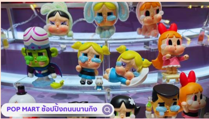
POP MART ซุปป์ิงถนนนานกิง