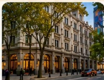
ถนน Anfu Lu