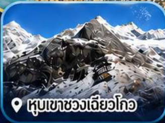
หุบเขาซองเจียวโกว