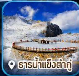
ธารน้ำแข็งต่ากู่