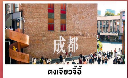
ตงเจียวจื่อ