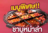
เมนูพิเศษ! ชาบูหม่าล่า