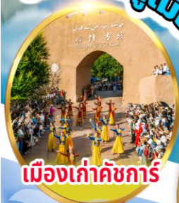
เมืองเก่าคัชการ์