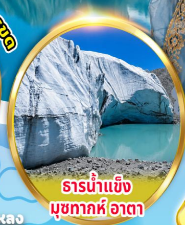
ธารน้ำแข็ง มุขทากห์อาตา