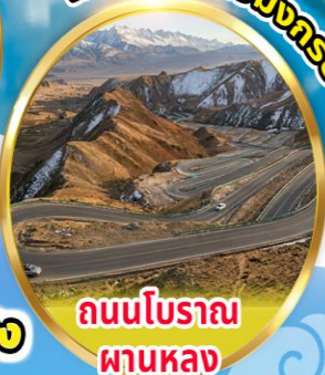
ถนนโบราณ ผานหลง