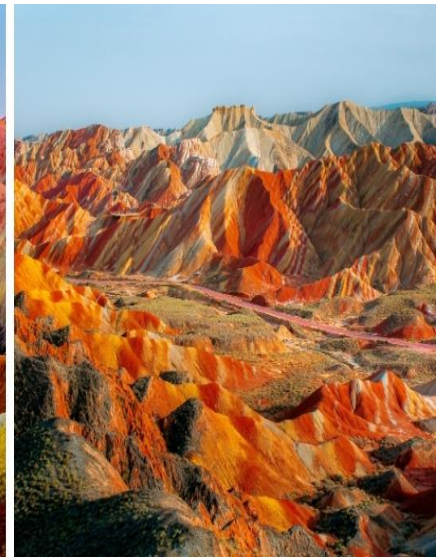
ภูเขาสายรุ้งจากเย่ตันเซีย