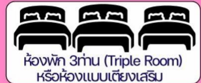
ห้องพัก 3 ท่าน (Triple Room) หรือห้องแบบเตียงเสริม

กรณีพัก 3 ท่านถ้าวันที่เข้าพักโรงแรม ไม่มีห้อง TRP (3 ท่าน) อาจจำเป็นต้องแยกพัก 2 ห้อง (มีค่าใช้จ่ายพักเดี่ยวเพิ่ม) กรณีห้อง TWIN BED (เตียงเดี่ยว 2 เตียง) ซึ่งโรงแรมไม่มีหรือเต็ม ทางบริษัทขอปรับเป็นห้อง DOUBLE BED แทนโดยมีต้องแจ้งให้ทราบล่วงหน้า หรือ หากต้องการห้องพักแบบ DOUBLE BED (1 เตียงใหญ่) ซึ่งโรงแรมไม่มีหรือเต็ม ทางบริษัทขอปรับเป็นห้อง TWIN BED แทนโดยมีต้องแจ้งให้ทราบล่วงหน้า กรณีห้องพักในเมืองที่ระบุไว้ในโปรแกรมมีเทศกาลวันหยุดยาว มีงานประชุมหรืองานแฟร์ต่างๆ บริษัทขอจัดที่พักในเมืองใกล้เคียงแทน