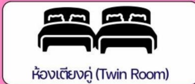
ห้องเตียงคู่ (Twin Room)