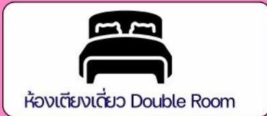
ห้องเตียงเดี่ยว Double Room