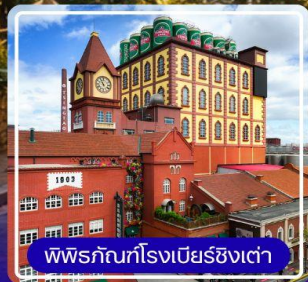
พิพิธภัณฑ์โรงเบียร์ชิงเต่า

SPECIAL OFFER *พร้อมชิมเบียร์ทานละ 1 แก้ว