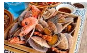
รูปภาพเพื่อประกอบการความเข้าใจเท่านั้น

เที่ยง 📍 บริการอาหารกลางวัน ณ ภัตตาคาร พิเศษ!! เมนูเซ็ทอาหารทะเล