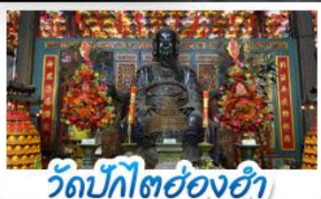
วัดปักโตฮองฮำ