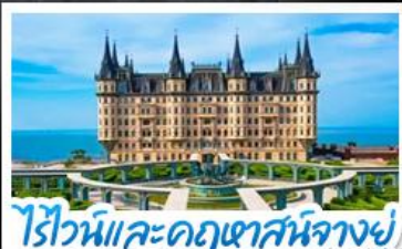
ไร่ไวน์และคฤหาสน์จางฮู