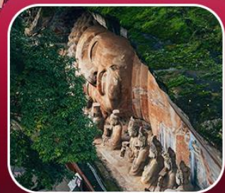
"ผาหินแกะสลักต้าจู้"