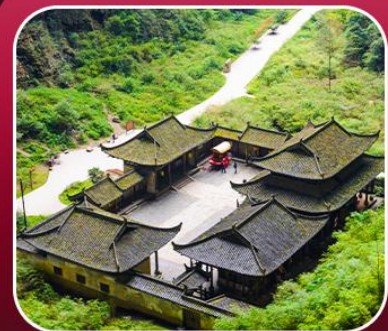
"อุทยานหลุมฟ้า"