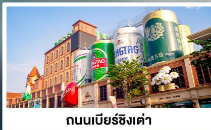
ถนนเบียร์ชิงเต่า