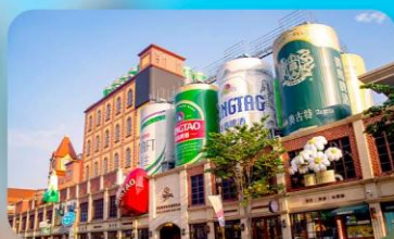
ถนนเบียร์ชิงเต่า