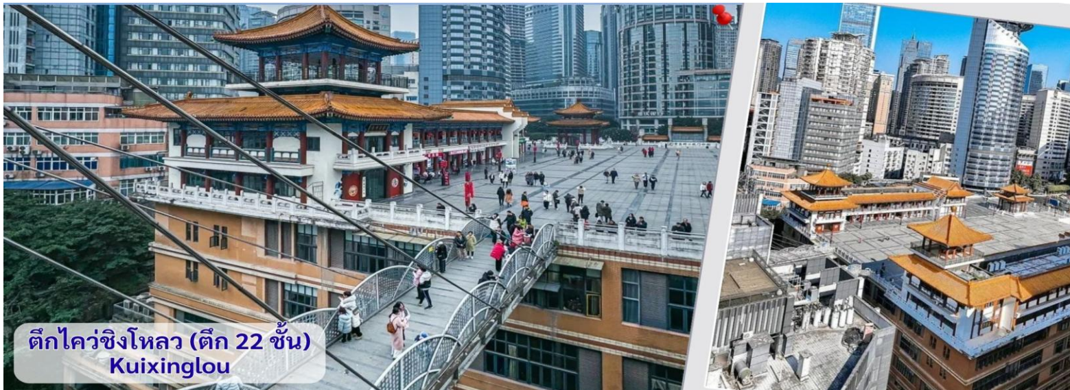
ตึกไควซิงโหลว (ตึก 22 ชั้น) Kuixinglou

นำท่านเดินทางไปชมความแปลกใหม่ที่ ตึกไควซิงโหลว (ตึก 22 ชั้น) Kuixinglou ชั้น 1 กลายเป็นชั้นที่ 22 ของอีกฝั่ง อาคารเก่าแก่ดั้งเดิมหัตถ์จรรยา ยังเป็นสถานที่ถ่ายทำภาพยนตร์เรื่อง "Young You" โดย Yi Yang Qianxi "Kui Xing Tower" อาคารโบราณที่ตั้งอยู่ในเมือง ที่นี้ได้รับการต่อเติมและสร้างขึ้นใหม่ในปี 1991 สิ่งหัตถ์จรรยาที่สุดที่นี่ไม่ใช่ตัวอาคาร แต่เป็นสะพานแขวนสองแห่งระหว่างจัตุรัสกับอาคารสำนักงาน สะพานแขวนที่เต็มไปด้วยรถกลมเชื่อมระหว่างชั้น 1 ของจัตุรัสกับชั้นบนสุดของชั้น 22 ฝั่งตรงข้ามมองลงมาจากชั้น 1 จะเห็นได้ว่าด้านล่างมี 22 ชั้น เป็นอาคารที่มีลักษณะพิเศษที่เมืองฉงชิ่ง ประเทศจีน เนื่องจากภูมิประเทศที่เป็นภูเขา อาคารแห่งนี้จึงมีทางเข้าในระดับที่ต่างกัน เป็นจุดถ่ายรูปและชมวิวที่โดดเด่นของเมืองฉงชิ่งที่ได้ชื่อว่าเป็น "เมืองสามมิติ"