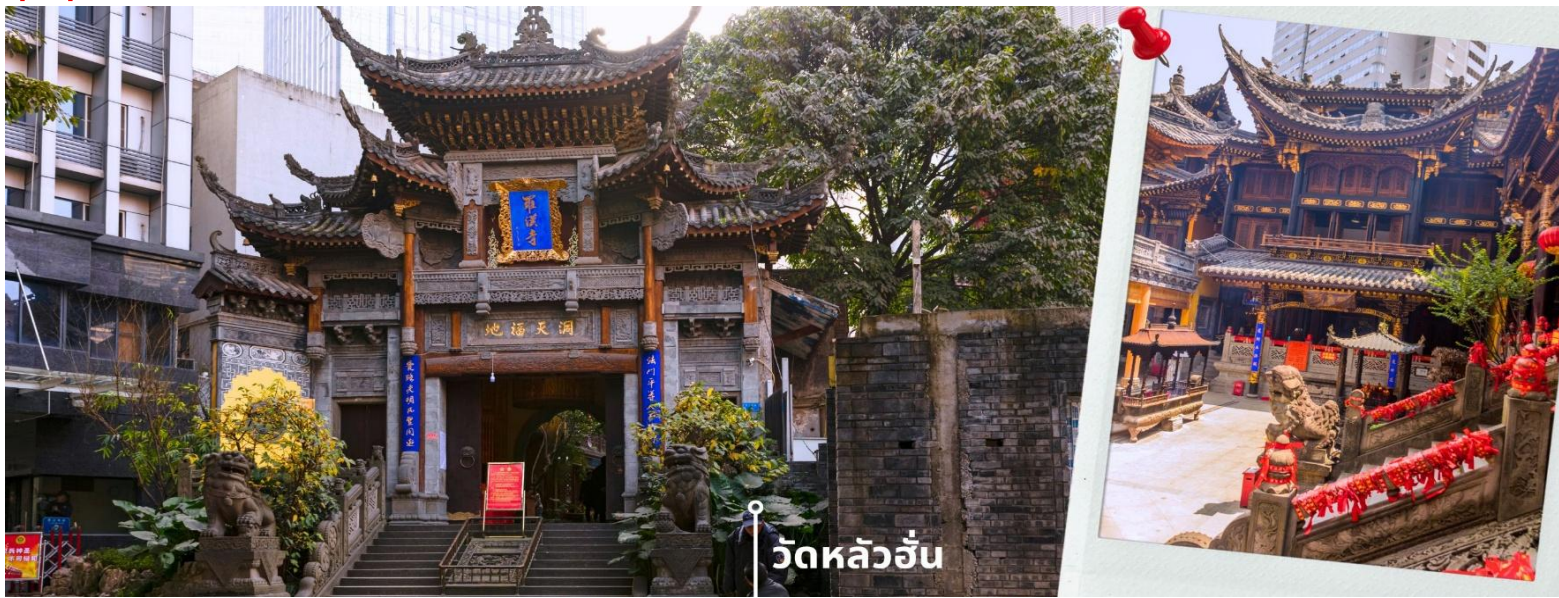
วัดหลวอัน