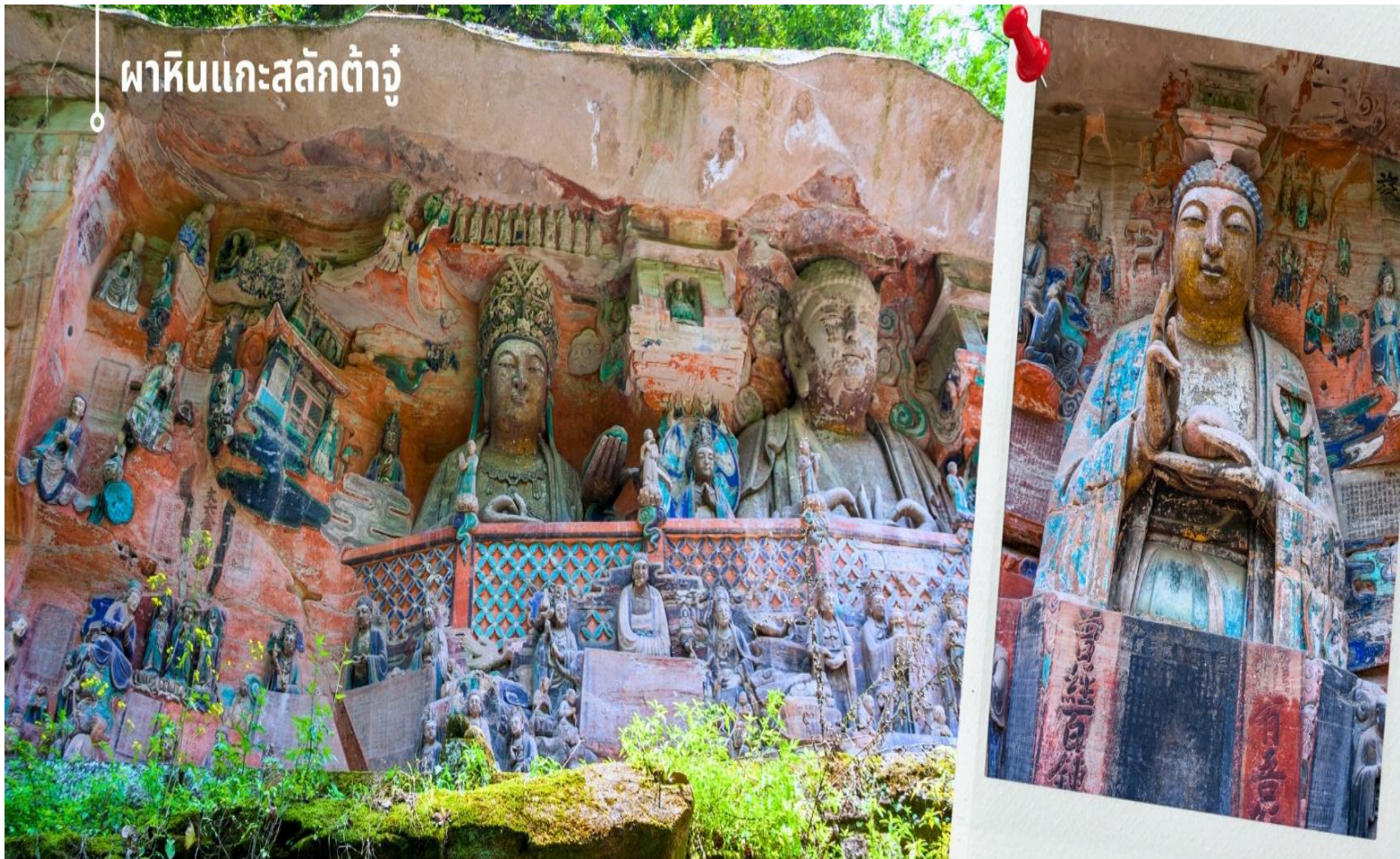
ผาหินแกะสลักต้าจู่

จากนั้นนำท่านเดินทางสู่ ผาหินแกะสลักต้าจู่ เขาเป่าตังซาน ผาหินแกะสลักที่ได้รับการบันทึกให้เป็นมรดกโลกทางวัฒนธรรม ที่ผสมผสานบนความเชื่อด้านศาสนาและเป็นงานศิลปะที่ผสมผสาน จุดเด่นของเมืองต้าจู่ที่แสดงถึงงานฝีมือในการแกะสลักถ้ำและผาหิน กลุ่มผาหินแกะสลักต้าจู่มีมากกว่า 70 จุด ชิ้นงานมากกว่า 1 แสนชิ้น ในนั้นถือว่า “เป่าตังซาน” และ “เป่ย์ซานม่อหย่า” สองสถานที่นี้มีหินแกะสลักชิ้นซื่อกมากที่สุด เน้นไปทางพุทธศาสนาเป็นแบบอย่างของถ้ำหินแกะสลักของประเทศจีนในยุคศิลปะตอนปลาย และ หินแกะสลักเป่าตังซาน เป็นตัวหลักในการขุดเจาะแกะสลักอย่างยากลำบากกว่า 70 กว่าปี หินแกะสลักที่นี้จะแกะตามรูปลักษณ์ของตัวภูเขา ด้วยความปราณีต และพิถีพิถัน มีความสวยงามเพียบพร้อมด้วยเนื้อหาบอกเล่าและเตือนสติผู้พบเห็น และยังมีการจัดแบ่งงานฝีมือของแต่ละยุคไว้ เป็นการประชันของช่างในแต่ละยุค ด้านใต้จะเป็นงานในยุคถึงตอนปลาย จนถึง ยุคห้ารัชกาล และ ด้านเหนือจะเป็นงานในสมัย ช่งเหนือซึ่งได้ ซึ่งงานฝีมือในแต่ละยุคจะสะท้อนความเป็นอยู่และค่านิยมที่ไม่เหมือนกัน