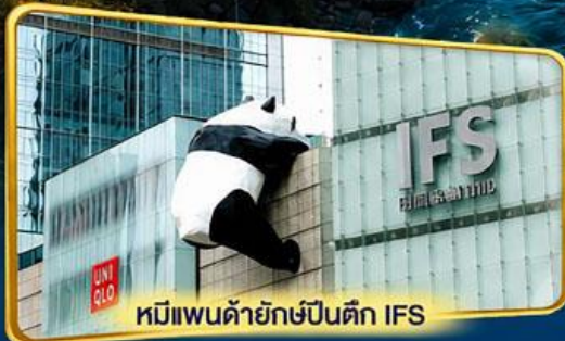
หมีแพนด้ายักษ์ปีนตึก IFS