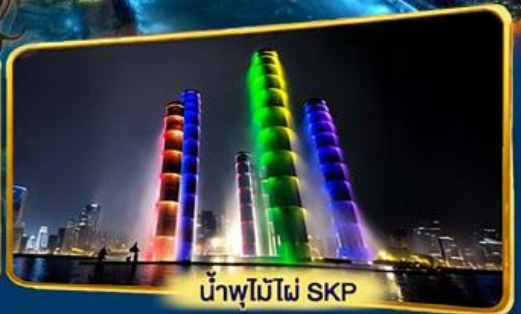
น้ำพุไม้ไฟ SKP