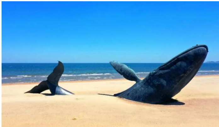
เรื่องราวผ่านมุมมองของตนเอง

จากนั้นนำท่านไป ท่าเรือประมงไห่ซาง (Haichang Fishing Port) อีสระให้ท่านเดินเล่นและถ่ายรูปชิลๆ ที่ ท่าเรือประมงไห่ซาง แลนด์มาร์คสโตนโรปริมพื้นน้ำ ที่เนรมิตบรรยากาศให้คล้ายกับเมืองตากอากาศในอเมริกาเหนือ โดดเด่นด้วยกลุ่มอาคารอิฐสีส้ม กระจกสี และร้านกาแฟสุดเก๋ ให้ท่านได้โพสต์ทำถ่ายรูปสไตล์สตรีทให้ได้ รับลมทะเลเย็นสบายๆ ในบรรยากาศสุดโรแมนติก