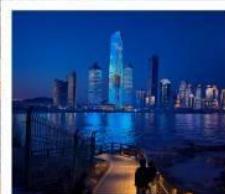
หาดไซเบอร์ NO.3

ทัวร์คุณธรรม ไม่หลงร้านช้อปปิ้ง ไม่ขายออฟชั่น