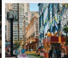
SILVER FISH ST.