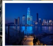
หาดโซเบอร์ NO.3

ของที่ระลึก สุดพิเศษ!! ขวดเบียร์สกรีนรูปของท่าน รับฟรี!! ท่านละ 1 ขวด