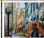
SILVER FISH ST.