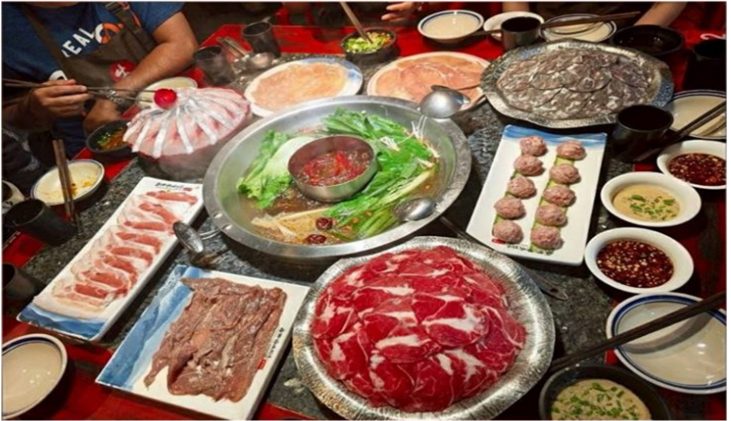
คำ รับประทานอาหารคำ ณ ภัตตาคาร (เมื่อที่ 12) *เมนูพิเศษสุกี้หม่าล่าเสฉวน

ดั้งเดิม มีทั้งแบรนด์แฟชั่นระดับโลกอย่าง Gucci, Chanel, Balenciaga รวมถึงร้านค้าไลฟ์สไตล์และแฟชั่นท้องถิ่น อาหารท้องถิ่นและคาเฟ่นานาชาติสวยๆ ที่เหมาะสำหรับการนั่งพักผ่อน