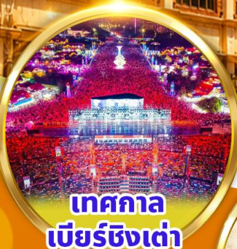
เทศกาล เบียร์ชิงเต่า