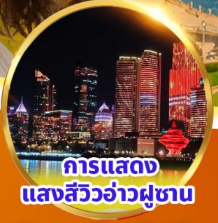
การแสดง แสงสีวิวอ่าวผู้ซัน