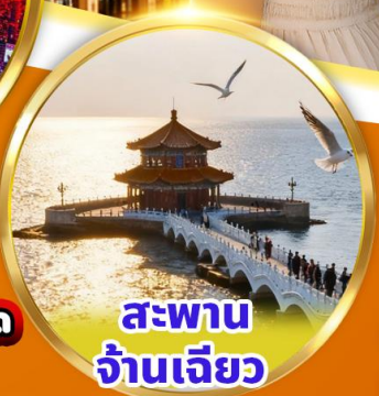
สะพาน จันเจียว