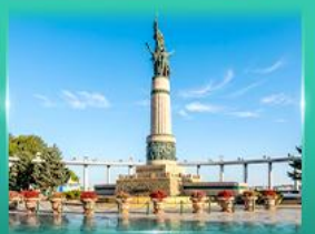
อนุสาวรีย์มังกรหยก