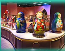
พิพิธภัณฑ์ ตุ๊กตาเปลือกถอด