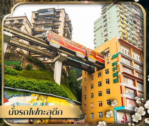
นั่งรถไฟทะลุถ้ำ

✈️ คอนเฟิร์มออกเดินทาง 📅 ตั้งแต่ 10 ท่าน ขึ้นไป