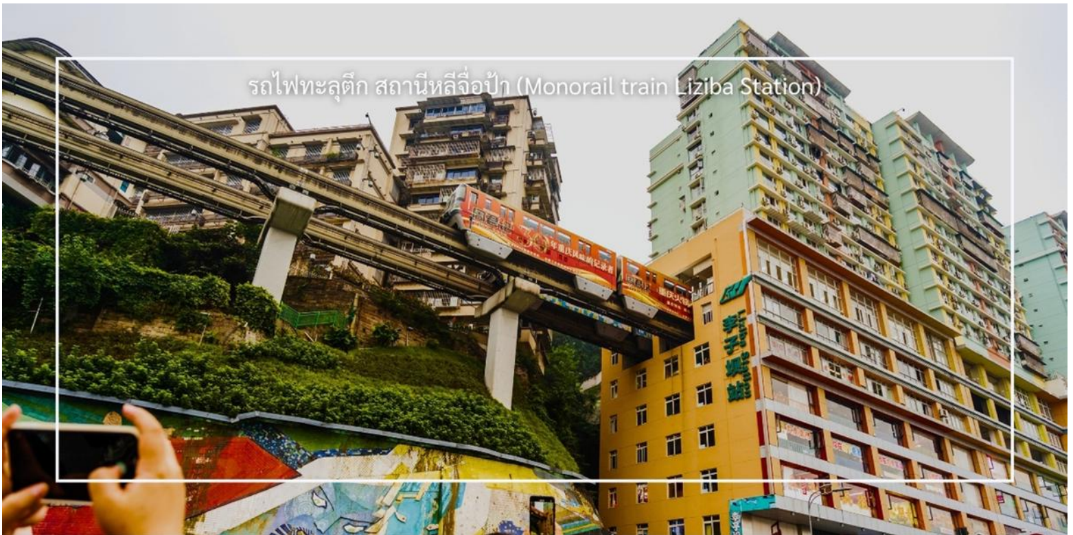
รถไฟทะลุตึก สถานีหลี่จื่อป่า (Monorail train Liziba Station)

จากนั้นนำท่าน นั่งรถไฟทะลุตึก (Monorail Train) หนึ่งในประสบการณ์ที่น่าสนใจและเป็นเอกลักษณ์ในเมืองฉงชิ่ง รถไฟเส้นนี้มีเส้นทางที่ผ่านอาคารและที่อยู่อาศัย ทำให้ผู้โดยสารรู้สึกเหมือนกำลังนั่งรถไฟที่ทะลุผ่านตึกสูง เส้นทางที่น่าสนใจในรถไฟนี้รวมถึงสถานีที่มีชื่อเสียง เช่น สถานีหลี่จื่อป่า (Liziba Station) ซึ่งตั้งอยู่ในพื้นที่ที่มีความหนาแน่นของประชากร การนั่งรถไฟทะลุตึกนี้เป็นวิธีที่ยอดเยี่ยมในการสัมผัสกับวัฒนธรรมเมืองฉงชิ่งและชื่นชมกับการพัฒนาเมืองที่น่าทึ่ง หากคุณมีโอกาไปเยือนฉงชิ่ง อย่าลืมลองนั่งรถไฟเส้นนี้เพื่อสัมผัสประสบการณ์ที่ไม่เหมือนใคร