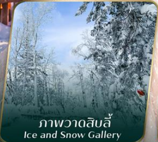
ภาพวาดลึกลับ Ice and Snow Gallery

คอนเฟิร์มออกเดินทาง ตั้งแต่วันที่ 15 กันยายน