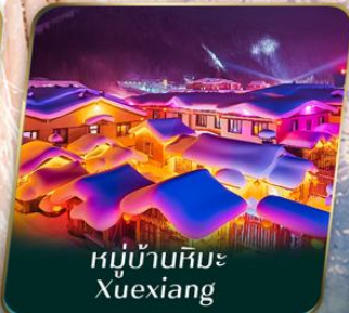
หมู่บ้านหิมะ Xuexiang