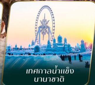
เทศกาลน้ำแข็ง นานาชาติ