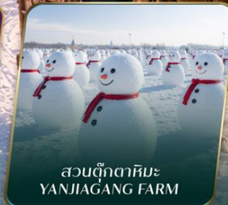
สวนตุ๊กตาหิมะ YANJIAGANG FARM