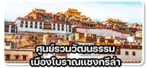
ศูนย์รวมวัฒนธรรมเมืองโบราณแชงกรีล่า