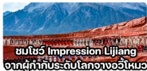
ชมโชว์ Impression Lijiang จากผู้กำกับระดับโลกจางอวี่ใหม่