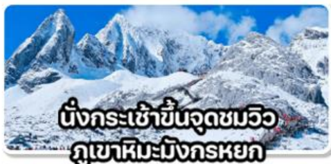
นั่งกระเช้าขึ้นจุดชมวิวกุเขาหิมะมังกรหยก

สวนน้ำตกคุนหมิง // เช็คอิน MOYE CAFE วัดลามะชงจ้านหลิน / ทะเลสาบไต้ส่วยเหอ นั่งรถไฟความเร็วสูง คุนหมิง-ต้าหลี่ เดินทาง ต.ค.-ธ.ค. 69