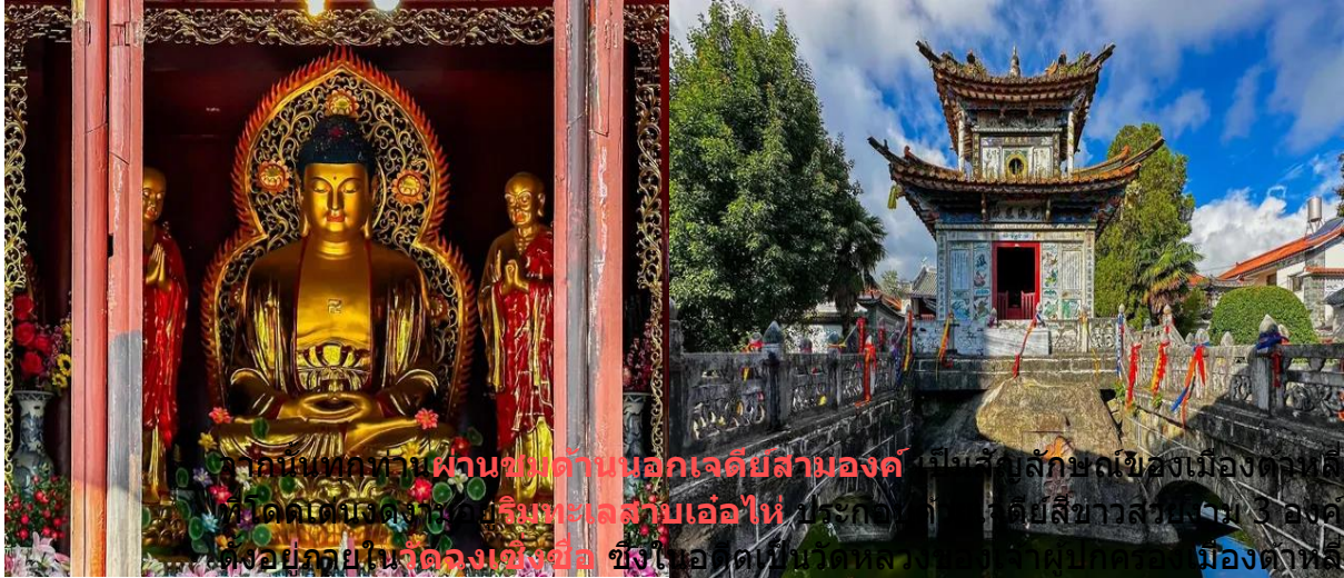
วัดเจติยสามองค์ ผ่านขบวนมอญเจติยสามองค์ เป็นสัญลักษณ์ของเมืองตงชอง วัดเจติยสามองค์ ตั้งอยู่ที่บ้านเรื่อนและสิ่งปลูกสร้างในเมืองได้รับความ เสียหายถึง 99% ชาวบ้านเชื่อว่าเจติยทั้งสามมีความศักดิ์สิทธิ์ซึ่งภัยธรรมชาติไม่ สามารถทำลายได้

ถูกสร้างขึ้นในศตวรรษที่ 12 เจติยสามองค์ไม่ได้รับความเสียหายในคราวที่เกิด แผ่นดินไหวในปี ค.ศ. 1925 ทั้งที่บานเรือนและสิ่งปลูกสร้างในเมืองได้รับความ เสียหายถึง 99% ชาวบ้านเชื่อว่าเจติยทั้งสามมีความศักดิ์สิทธิ์ซึ่งภัยธรรมชาติไม่ สามารถทำลายได้