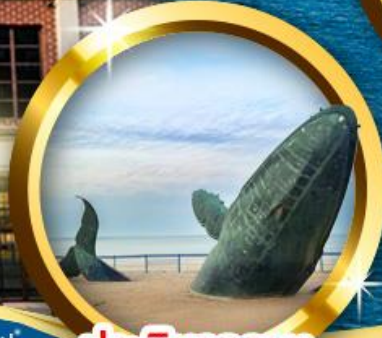
ประติมากรรม วาฬผู้โดดเดี่ยว