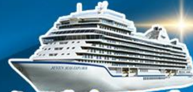
พักบนเรือสำราญ 2 คืน