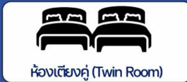
ห้องเตียงคู่ (Twin Room)