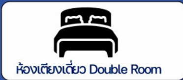
ห้องเตียงเดี่ยว Double Room