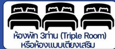
ห้องพัก 3 ท่าน (Triple Room) หรือห้องแบบเตียงเสริม

กรณีพัก 3 ท่านถ้าวันที่เข้าพักโรงแรม ไม่มีห้อง TRP (3 ท่าน) อาจจำเป็นต้องแยกพัก 2 ห้อง (มีค่าใช้จ่ายพักเดี่ยวเพิ่ม) กรณีห้อง TWIN BED (เตียงเดี่ยว 2 เตียง) ซึ่งโรงแรมไม่มีหรือเต็ม ทางบริษัทขอปรับเป็นห้อง DOUBLE BED แทนโดยมีต้องแจ้งให้ทราบล่วงหน้า หรือ หากต้องการห้องพักแบบ DOUBLE BED ( 1 เตียงใหญ่) ซึ่งโรงแรมไม่มีหรือเต็ม ทางบริษัทขอปรับเป็นห้อง TWIN BED แทนโดยมีต้องแจ้งให้ทราบล่วงหน้า กรณีห้องพักในเมืองที่ระบุไว้ในโปรแกรมมีเทศกาลวันหยุดยาว มีงานประชุมหรืองานแฟร์ต่างๆ บริษัทขอจัดที่พักในเมืองใกล้เคียงแทน