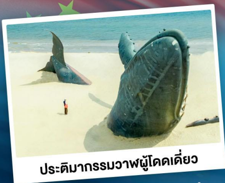
ประติมากรรมวาฬผู้โดดเดี่ยว

เที่ยวเมืองชายทะเลไวป่ดีดี ซิงเต่า - ต้าเหลียน - แฉจิงไก