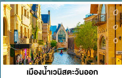
เมืองน้ำเวนิสตะวันออก