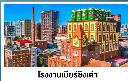
โรงงานเบียร์ซิงเต่า