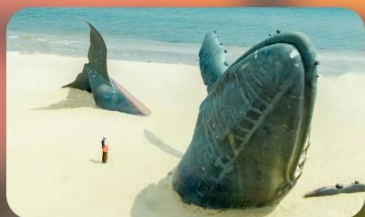
ประติมากรรมวาฬโดคเตี้ยว