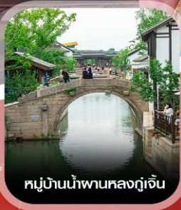
หมู่บ้านน้ำผานหลงกู่เจิน