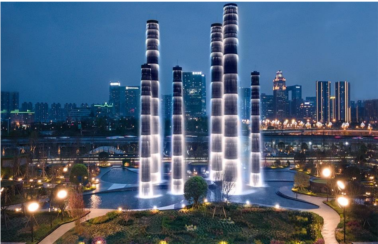
เสาน้ำพุไม้ไฟ SKP Chengdu ตอนกลางคืนมีเปิดไฟเล่นแสงสีที่ตัวเสาแบบสวยงามมากด้านล่างเป็นห้างแบรนด์ เนมอย่างหรูเหมาะกับสายลัทธิ