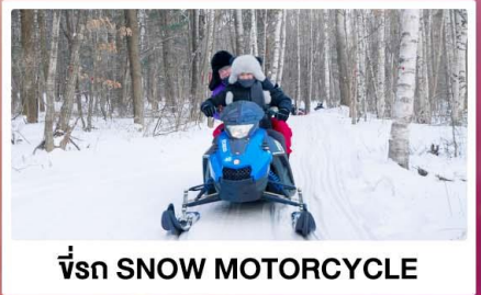
ขี่รถ SNOW MOTORCYCLE