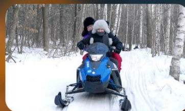
จักรยาน SNOW MOTORCYCLE