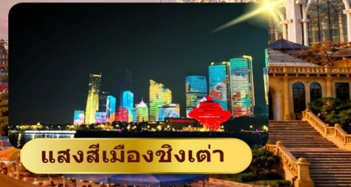
แสงสีเมืองชิงเต่า