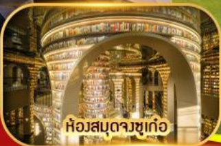
ห้องสมุดจางซูเก๋อ