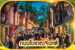
ถนนโบราณจันหลี่