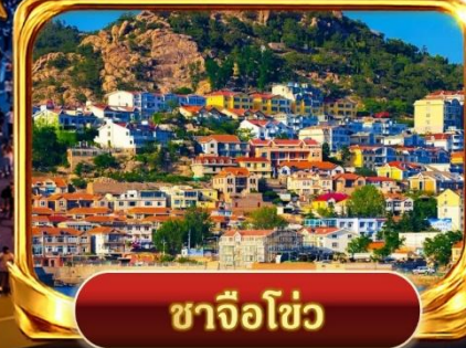
ซาจิวโซ่ว