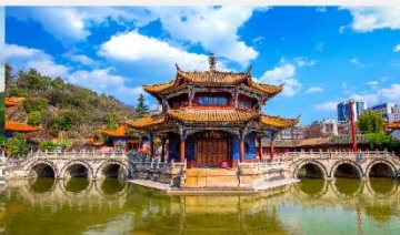
วัดหยวนกง