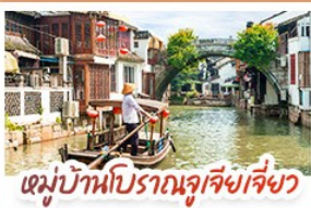
หมู่บ้านโบราณจูเจี๋ยเซี่ยว

สวนสนุกเซี่ยงไฮ้ดิสนีย์แลนด์ เต็มวัน (รวมรถรับ-ส่ง)