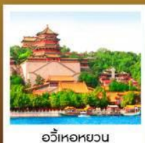
อวี่เหอหยวน

ลิ้มรสเมนูพิเศษ เปิดปักกิ่ง / สุกี่มองโกล มิชซอลิน TAO TAO JU