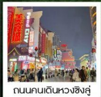
ถนนคนเดินหวงชิ่งอู่