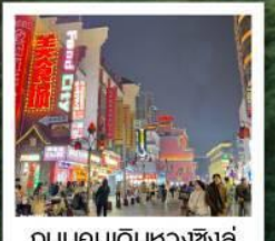
ถนนคนเดินหวงชิ่งลู่

ถนนคนเดินต้าซือเหอเจีย • น้ำตกฟูหลง (รวมค่าเช่าถ่ายรูปกับวิวน้ำตกท่านละ 1 รูป) • ชมบรรยากาศยามค่ำคืนเมืองโบราณฟูหลงจีน ดวงตาแห่งเฟิ่งหวง • หอคอยประตูเมืองตะวันออก • Bar Street • เมืองโบราณเฟิ่งหวง • สะพานสายรุ้ง ล่องเรือตามลำน้ำทิวเจียง ชมเมืองโบราณเฟิ่งหวงยามค่ำคืน • อำเภอเจียงโข่ว • เขาฟานจิ้งซาน (รวมกระเช้าขึ้น-ลง+รถอุทยาน) หงอวั้นจินตัง • เสาศินเห็ด • เมืองถงเหริน • จุดชมวิวผาผืนธงเสฉวน • วัดโกฟู่ • ถนนหวงชิ่งลู่ • อีระช้อปบิ่งเอ๋ากั๊กเล็กฉางซา