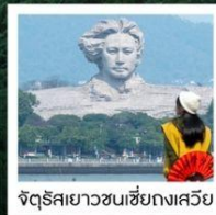
จัตุรัสยาวขนเซี่ยงเสวีย

จางเจียเจี๋ย เฟิ่งหวง • ฟ่านจิ้งซาน • ฉางซา