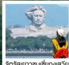
จุดชมวิวผาผืนธงเสฉวน

จางเจียเจีย เฟิ่งหวง • ฟ่านจิ้งซาน • ฉางซา