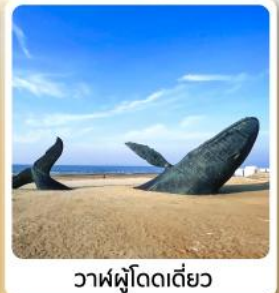
วาฬผู้โดดเดี่ยว