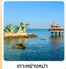
เกาะหย่างหม่า