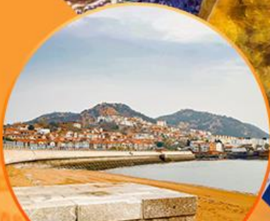
ซาจื่อโป่ว