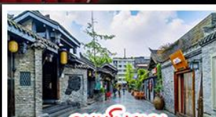
ถนนโบราณ ชอยกวางชอยแคว