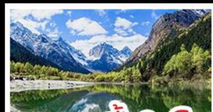
อุทยานปี่เป็งโกว

16 - 21 ก.ค. 69 26,900 03 - 08 ก.ย. 69 27,900 23 - 28 ก.ค. 69 26,900 12 - 17 ก.ย. 69 27,900 08 - 13 ส.ค. 69 27,900 19 - 24 ก.ย. 69 27,900 27 ส.ค. - 01 ก.ย. 69 27,900 24 - 29 ก.ย. 69 27,900