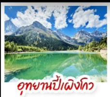
อุทยานป่าผิงโกว

มรดกโลกพระพุทธรูปแกะสลักหินตัวจู้ - อุทยานหลุมบ่อฟ้าสะพานสวรรค์ อุทยานเขานางฟ้า - หงหยาดัง - ดิถุยซิง ซัน 22 - ชมรถไฟความเร็วสูง สะพานโบราณหนานเฉียว - เมืองโบราณกวนเฉียน - อุทยานภูเขาซีดรูณี อุทยานป่าผิงโกว - ถนนโบราณชอยกว้างชอยแคบ - วัดต้าเฉียว ถนนคนเดินซุนชี่ - หมีแพนด้าป็นตักIFS - ถนนไท่กู่หลี่