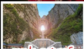
เขาประตูลั่วจื่อ