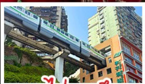
รถไฟทะลุคิ๊ต