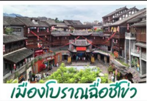
เมืองโบราณฉือซีโข่ว

อุทยานสี่ดรุณี - อุทยานเขานางฟ้า อุทยานหลุมบ่อฟ้า - เมืองโบราณฉือซีโข่ว หลงหยินเทียนเจิง - หงหยาดัง