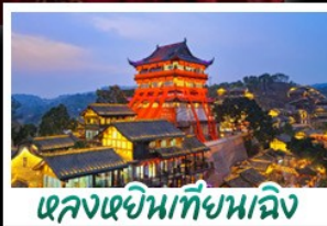
เจหลงเฉียนเทียนเจิง