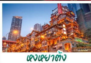
เจงเฉาตัง