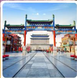
ถนนโบราณเจียนเหมิน