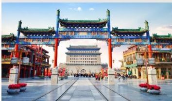
ถนนโบราณเจียนเหมิน