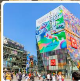
ย่านชานหลิง