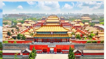
พระราชวังต้องห้ามกู่กวง

*ทางบริษัทฯ ขอสงวนสิทธิ์ในการสลับโปรแกรมทัวร์ตามความเหมาะสมขึ้นอยู่กับสถานการณ์หน้างาน โดยคำนึงถึงผลประโยชน์ของลูกค้าเป็นสำคัญ